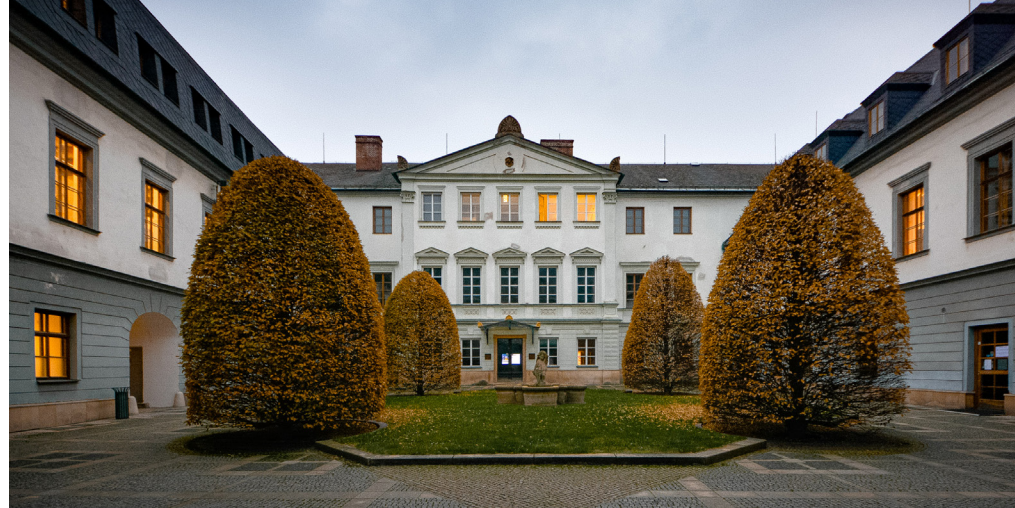
↑ Rektorát UP