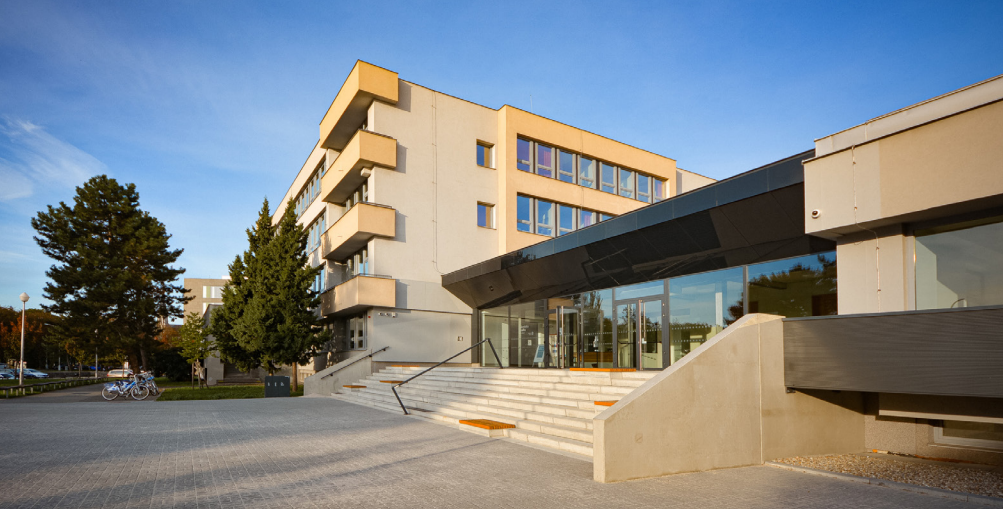
Právnická fakulta UP – Budova B ↑