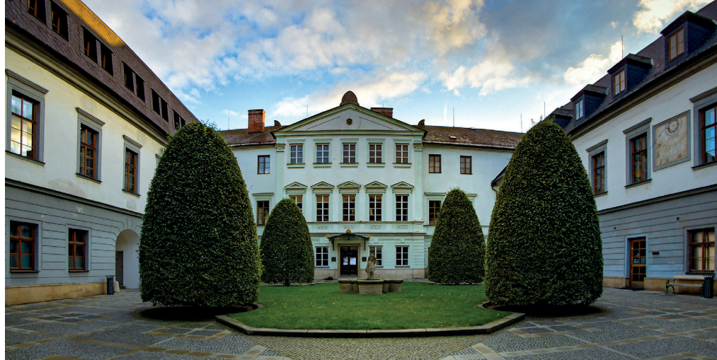
↑ Budova rektorátu Univerzity Palackého