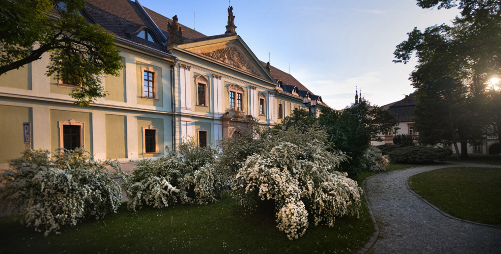
Zbrojnice UP ↑