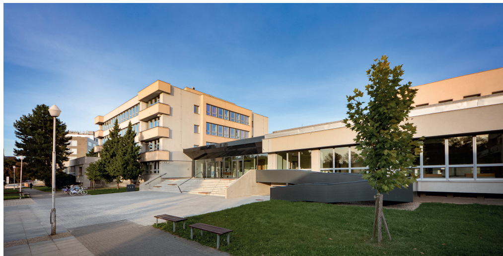
↓ Budova Právnické fakulty Univerzity Palackého